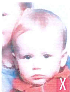
presenza di altra persona