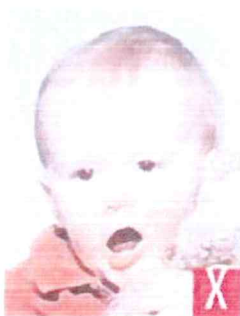
bocca aperta e giocattolo troppo vicino al viso