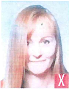
capelli sugli occhi