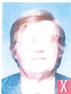
riflesso del flash sulle lenti