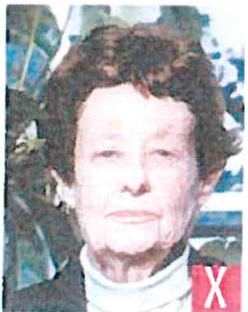
sfondo non a tinta unita