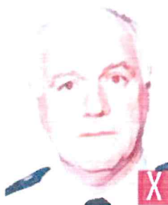
effetto occhi rossi