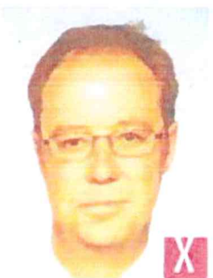
tonalità innaturale della pelle