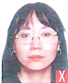
montatura che copre gli occhi