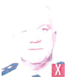
riflesso del flash sulla pelle