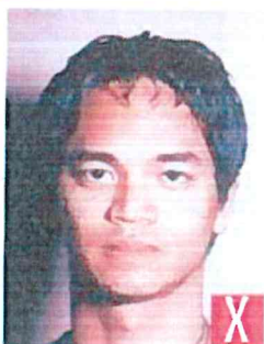
ombra dietro la testa