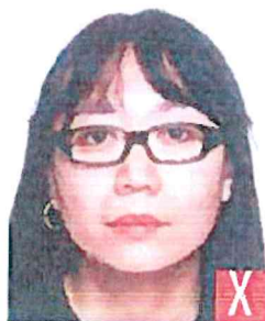
montatura troppo pesante