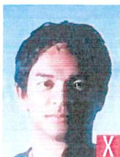
ombre sul viso