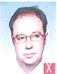
sguardo rivolto di lato